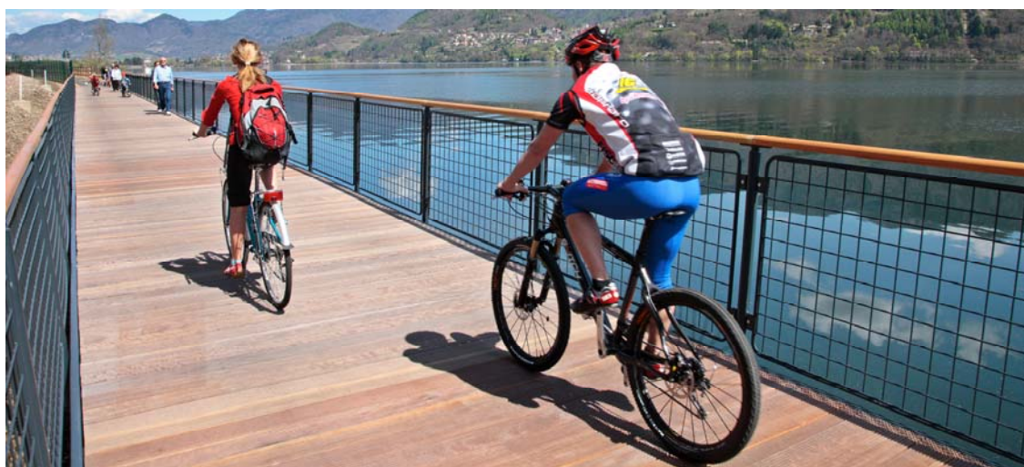
Tabella passaggi annuali: pedoni, ciclisti e totali (anno 2016)