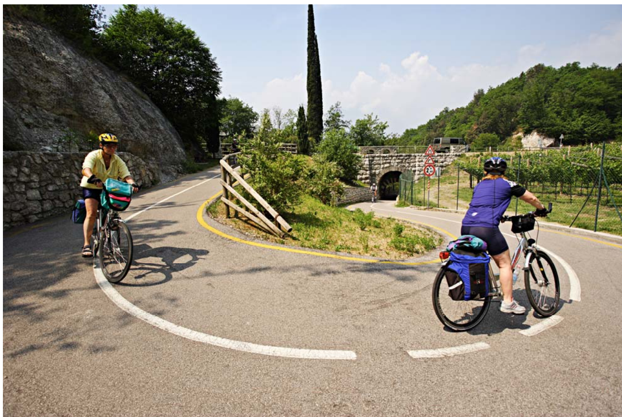
Pista ciclabile Mori - Torbole

Due piccole curiosità: le stazioni di Arco, Loppio e Ziano sono quelle che hanno rilevato la percentuale più elevata rispetto alla media dei passaggi di ciclisti (89 %), mentre a quella di Sarnonico spetta il record di maggiore percentuale di passaggi di pedoni (42 %).